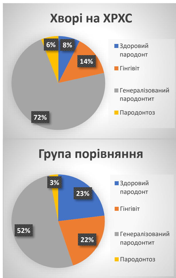
Рис. 1. Стан тканин пародонта в групах спостереження

Хронічний катаральний гінгівіт виявлено в 15,19 \pm 1,39 % обстежених осіб основної групи та у