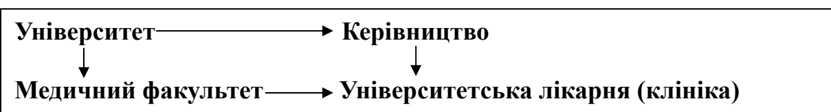
Рис. 1. Інтеграційна модель університетської лікарні

В умовах України найбільш прийнятною є модель створення Державної корпорації (об'єд-