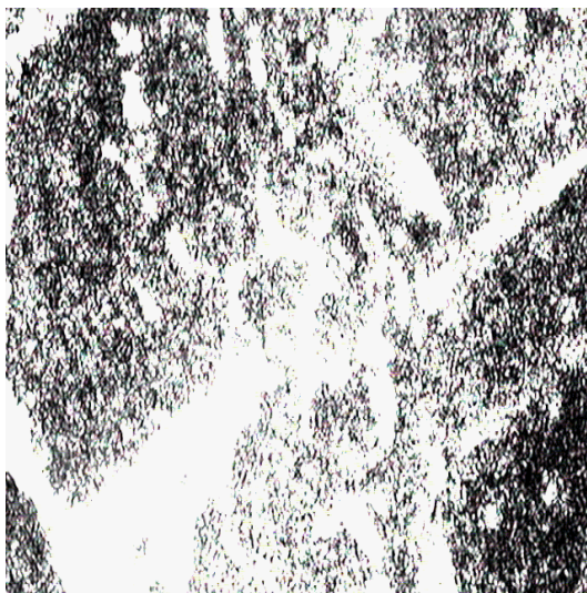
0 – 0