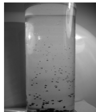
Рис. 3. Седиментаційний аналіз осадження подрібнених частинок тестового матеріалу