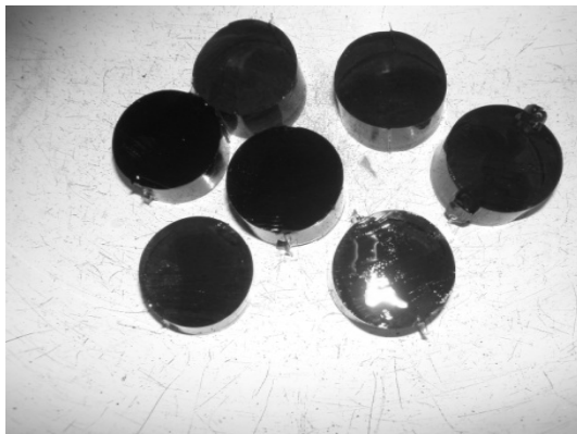
Рис. 1. Тестовий матеріал для проведення жувальної проби

Значення середнього діаметра подрібнених частинок склали в осіб з одним повним знімним протезом – 2,61 \pm 0,04 мм (0,261 см), а з двома – 2,90 \pm 0,06 мм (0,290 см), що було більшим порів-