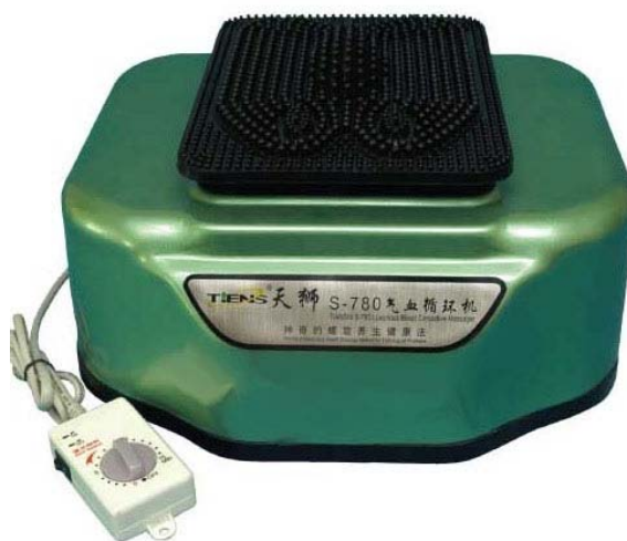
Рис. 1. Вібратор механічних періодичних коливань (СЦЕК) з таймером та гумовою платформою

Акронім СЦЕК означає стимулятор циркуляції енергії крові. Сама назва визначає його цільове призначення. Використання механічного вібромасажу в оздоровчих центрах підтверджує його загальнооздоровчу дію. У практиці він використовується при проблемах з опорно-руховою системою, артритом, варикозному розширенні вен, хронічних втомах. Тривалість вібраційного масажу контролюється вбудованим таймером.