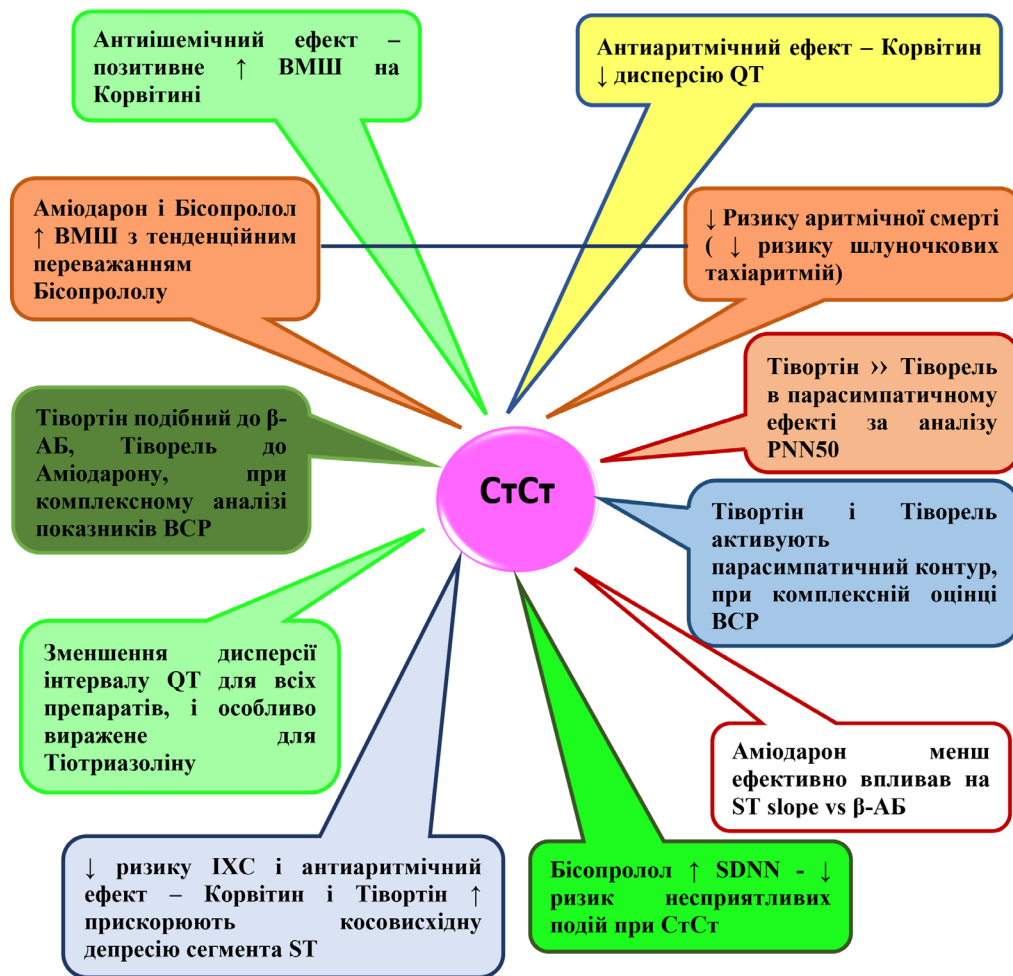
Рис. 1. Оцінка змін кількісних показників програми «Smart-ECG» при дигіталізації електрокардіограми у хворих на стабільну стенокардію на фоні кардіоцитопротекції

го зубця Т при побудові першої похідної стандартної ЕКГ у розподілі діагнозів СтСт та Q-ІМ. Зіставленню кардіоцитопротективної дії піддана оцінка ефектів метаболічних засобів та результатів застосування антиішемічних та антиаритмічних [17] препаратів II і III класів згідно з класифікацією Е. М. Vaughan-Williams (β-АБ Бісопролол і БКК Амідарон).