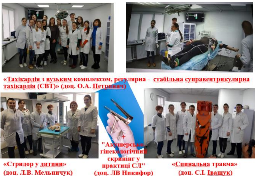
Рис. 11. Симуляційні сценарії відпрацьовані кафедрою сімейної медицини на базі Навчально-тренінгового центру симуляційної медицини БДМУ «Cosmit»

Таким чином, кафедра сімейної медицини БДМУ забезпечує ефективну підготовку сімейних лікарів на додипломному та післядипломному рівнях для