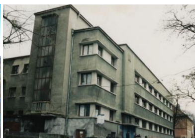
Рис.3. КНП «Міська поліклініка №1»