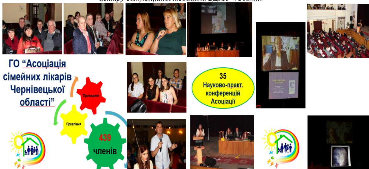
Рис. 12. Засідання ГО "Асоціація сімейних лікарів Чернівецької області"