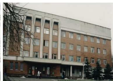
Рис.4. КНП «Міська дитяча поліклініка»