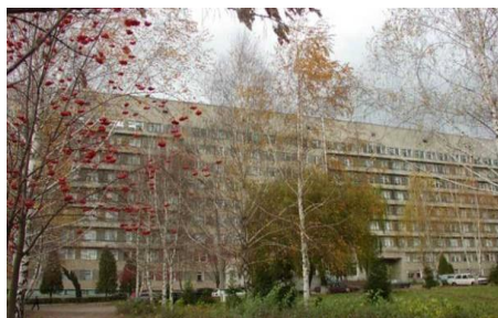
Рис.5. ОКНП «Лікарня швидкої медичної допомоги»