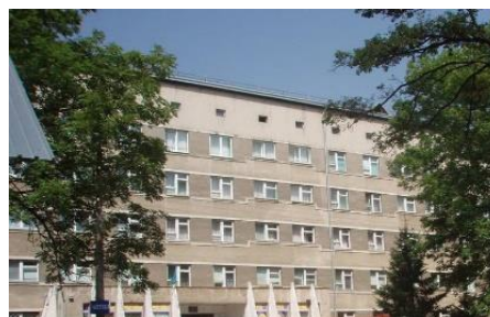
Рис.6. ОКНП «Чернівецький обласний перинатальний центр»

«Медсестринство» (освітнього ступеня – молодший спеціаліст, бакалавр, магістр).