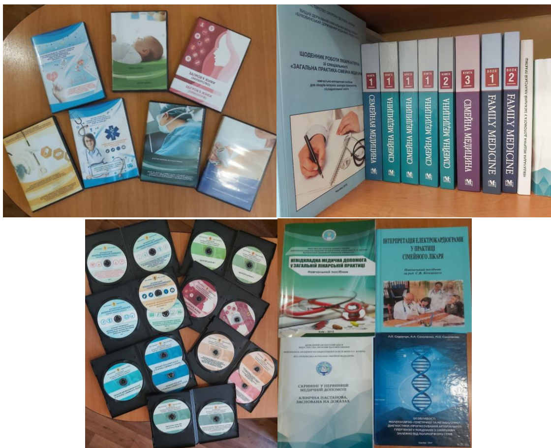
Рис. 9. Окремі навчально-методичні матеріали видані кафедрою сімейної медицини за 2015-2020 роки тивний метод заснований на холістичному підході до проблеми пацієнта) зі зміною парадигми на пацієнт-орієнтоване і студенто-центроване навчання, ділові ігри, навички комунікації (soft skills, hard skills); формування командного підходу (team-working) в роботі та навчання; імплементація принципів науково-доказової медицини (рис. 10). "Золотим

стандартом" практичної підготовки лікарів-інтернів залишається робота з пацієнтом (амбулаторний прийом, робота в клініці, чи огляд вдома, телемедицина в умовах карантину).