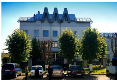
Рис.2. КНП «Міська поліклініка №3»