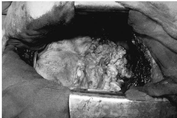
Рис. 4. Завершений вигляд оментопластики кукси бронха та дефекту перикарда