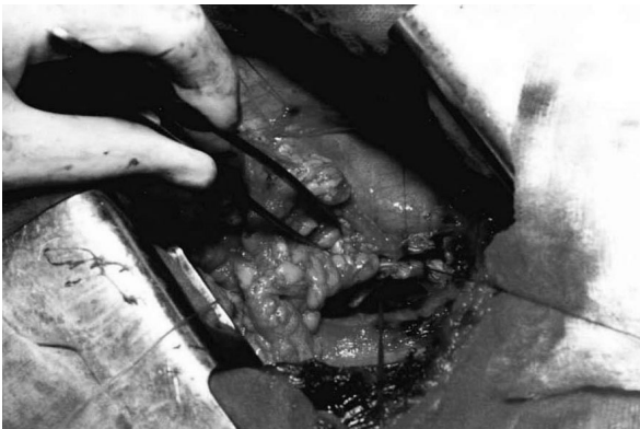
Рис. 2. Загальний вигляд сформованого пасма сальника, достатньої довжини. Збережені судинні аркади

цього етапу є необхідним для запобігання деформації товстої кишки та порушення пасажу кишкового вмісту після операції.