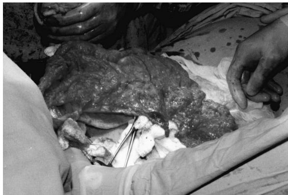
Рис. 3. Пасмо проведено в плевральну порожнину, виконується пластика дефекту перикарда сальником

Як свідчать результати проведеного топографо-анатомічного дослідження, шлях проведення пасма сальника через діафрагму має велике значення, що зумовлено ризиком виникнення після-