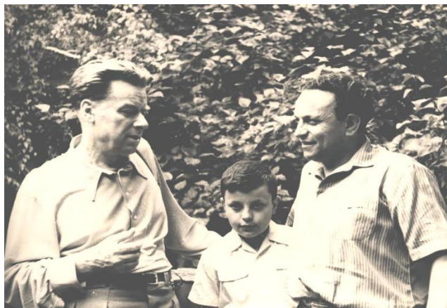
Рис. 5. М.Г. Туркевич з доц. Г.Г. Фішером "... наукові праці М.Г. Туркевича по вивченню

«... М.Г.Туркевич є представником оригінальної школи анатомів-ембріологів. Він відомий своїми прекрасними працями по ембріології і анатомії центральної нервової системи і є одним із видатних спеціалістів в ембріології головного мозку. М.Г. Туркевич відомий як висококваліфікований лектор, його педагогічний талент дав можливість здобути авторитет серед студентів і повагу серед колег, які працювали з ним» – Г.Г. Фішер (рис. 5.);